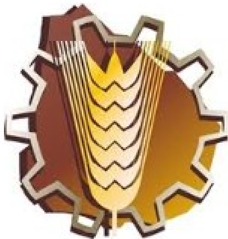
Logo de la U. T. U.

La Dirección General de Educación Técnico Profesional es un organismo de la Administración Nacional de Educación Pública encargada de impartir la formación profesional y tecnológica mediante la Universidad del Trabajo del Uruguay.